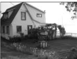
Vue sur les jardins

personnalisés 24h/24h 7 jours sur 7 tout au long de leur séjour. La résidence a un personnel qualifié et accueille des personnes en convalescence, des personnes en perte d'autonomie et des personnes nécessitant des soins palliatifs.