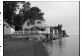
Vue du fleuve

La Résidence L'Ombrelle de Cap-Saint-Ignace est fière d'avoir maintenant reçu la certification des résidences privées pour les personnes âgées. Cette certification garantit la qualité des services dispensés répondant aux normes gouvernementales des résidences privées.